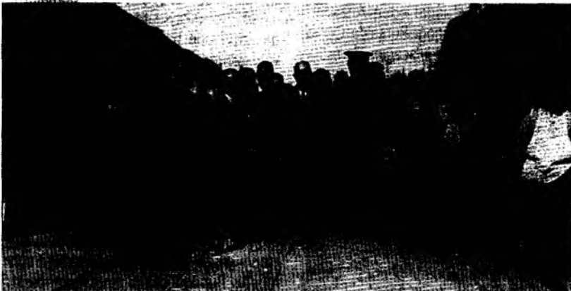
Atatürk'ün Bandırma'yı Ziyareti 1925

Bu arada, Kuvâ-yı Millîye'yi içten parçalamak için, Hürriyet ve İtilaf Fırkası ile Askerî Nigezbân (bekçi, gözcü) Cemiyeti ve Kızıl Hançerliler Cemiyeti, Boğazlardaki İngiliz egemenliğine güvenerek, Anadolu ile Boğazlar arasında bir irtica bölgesi hazırlamaya çalışmış ve bunun için de aralarında anlaşarak "Cemiyet-i Ahmedîye"yi kurmuşlardı. Onlar bu suretle, Yunanlılara karşı kurulmuş olan Balıkesir'deki Türk Millî Cephesini arkadan vurarak dağıtmayı düşünüyorlardı 20 . Halkın taassubundan yararlanarak "Kuvâ-yı Muhammediye" adı verilen bir kuvvet toplamayı, Biga'da teşkilatlarını tamamladıktan sonra Gönen'i elde edip Bursa'ya doğru ilerlemeği, İngilizlerle birlikte harekete ederek hükümeti düşürmeği ve Damat Ferit başkanlığında bir hükümet